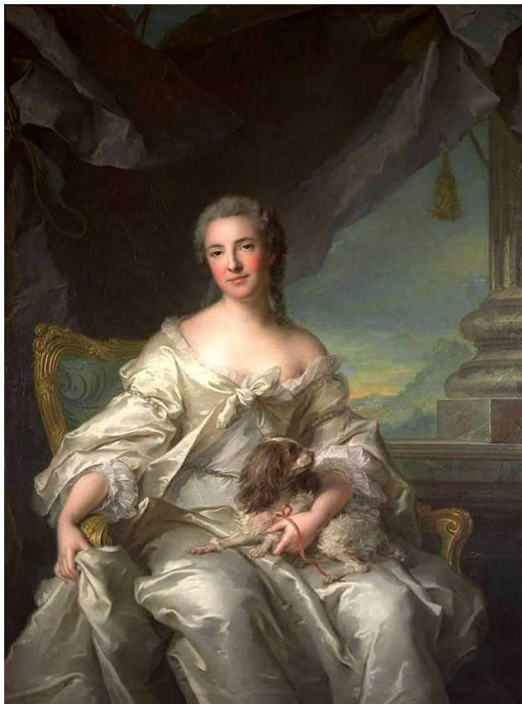
Madame la comtesse d'Argenson , peinte par Jean-Marc Nattier, en 1743 - collection particulière.

Poitiers Nous étions ce vendredi 3 mars de passage à Poitiers, pour consulter les Archives d'Argenson, conservées depuis 1975 par le Fonds ancien des Bibliothèques de l'université de Poitiers. Quelle relation peut-il y avoir entre la famille d'Argenson et les castrats italiens ?