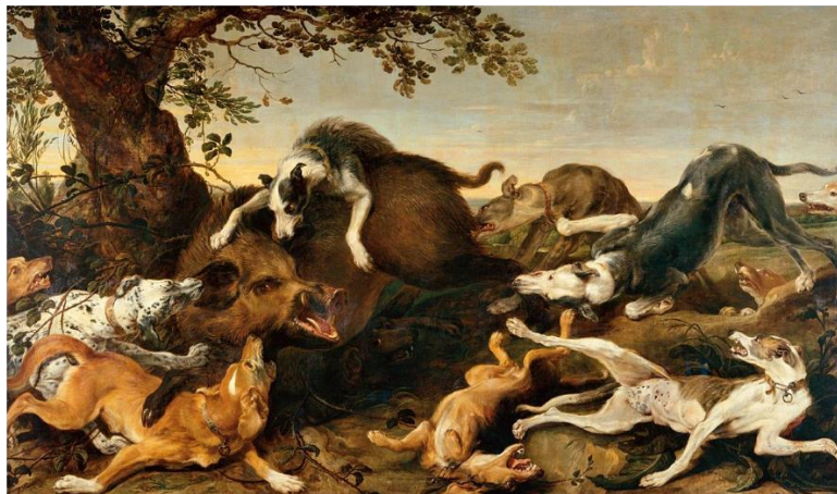
Chasse au sanglier, Frans Snijders, Museum Rockoxhuis, c. 1620-1630.

*Équipage important composé de chiens courants spécialisés dans la chasse du sanglier (s.v. "vautrait", CNRTL)